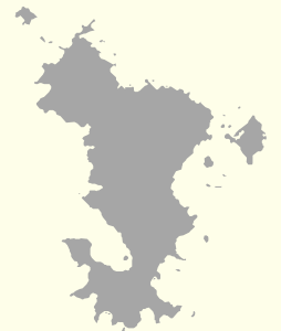
Maoré (non enquêtée)